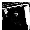
Kim Jong Il ist tot