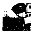
Chronik der Politik 2011