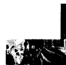
Trauer um Vaclav Havel